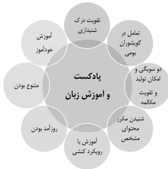
نمودار ۱. قابلیت‌های پادکست در آموزش زبان

ویژگی به زبان‌آموزان امکان می‌دهد که پادکست تولید کنند و پادکست‌های خود را به اشتراک بگذارند. این امکان نه تنها به تقویت درک شنیداری کمک می‌کند، بلکه به تصحیح تلفظ نیز می‌انجامد. تولید گزارش، مصاحبه و یا گفتگو در قالب پروژه تعامل زبان‌آموزان را با یکدیگر افزایش می‌دهد و در واقع شنونده را به گوینده و گوینده را به شنونده تبدیل می‌کند (Schatz, 2006: 20).