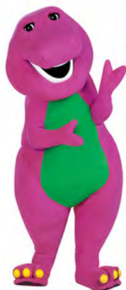
شکل ۱- شخصیت «بارنی»

بارنی، زابیده تخیل کودکان و قهرمان اصلی برنامه است، بنابراین تمام ایده‌های بارنی، ایده‌های کودکان به حساب می‌آیند. مخاطب، فانتزی را از منظر تخیل آنها می‌بیند. بارنی عاشق رقصیدن، بازی کردن و یادگیری در مورد کمک به دیگران در همسایگی خود است و چشمان کودکان را به لذت یادگیری و کشف، شگفتی‌های دنیای ساختگی و زیبایی عشق بی‌قید و شرط باز می‌کند.