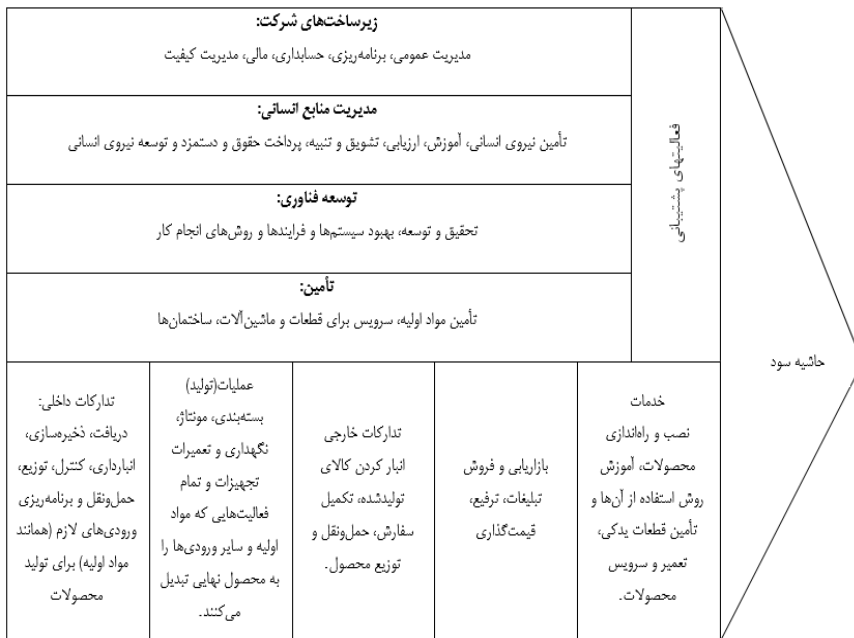
تصویر ۱. مدل زنجیره ارزش پورتر

براساس مدل پورتر حوزه‌های کاری زنجیره ارزش سازمان به دودسته کلی تقسیم می‌شوند: