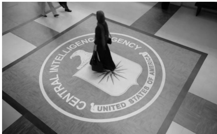
تصویر ۳. ورود یک مسلمان معتقد به چارچوب امنیتی ایالات متحده

سی‌آی‌ای، را می‌توان دور شدن او از تروریسم و نزدیک‌شدنش به افرادی تفسیر کرد که قرار است با تروریسم مقابله کنند.