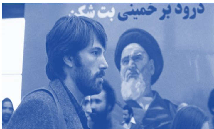
تصویر ۱. پن آفلک در نمایی از فیلم سینمایی آرگو

در این دوران، فیلم‌های متعددی نظیر ۳۰۰، آرگو ۱ (تصویر شماره ۱) و سنگسار ثریا م. ۲ (باز هم با بازی شهره آغداشلو) نیز به‌طور مشخص در مورد ایران ساخته شدند و به بازنمایی هویت ایرانی پرداختند.